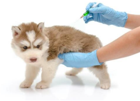
Slika 1 Cijepljenje psa

Cijepljenje pasa provodi se i na terenu po mjestima i naseljima, a oglašava se pomoću oglasnih ploča na kojima se nalaze informacije o datumu obavljanja cijepljenja i cijeni cjepiva.