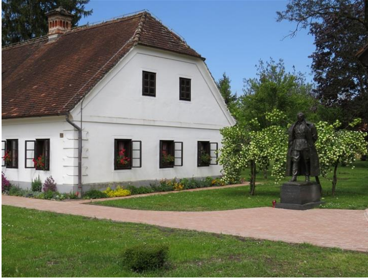
Slika 5. Muzej "Staro selo" Kumrovec