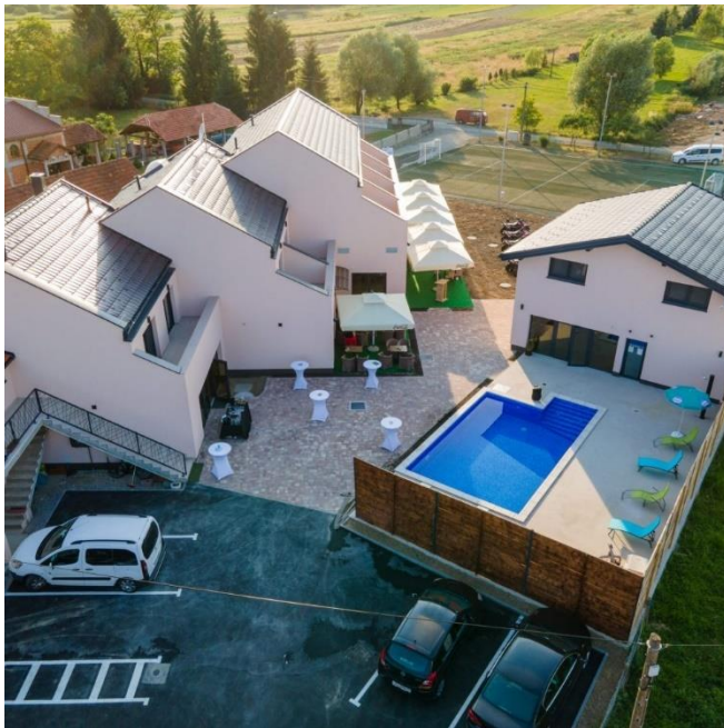
Slika 8. Kompleks Zagyland