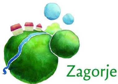
Slika 2. Logo Hrvatskog Zagorja

kao jedinstvenu turističku destinaciju koja bi mogla privući brojne ciljne skupine od domaćih do inozemnih turista pa i do novih investitora ( https://kzz.hr/aktivnosti-krapinsko-zagorske-zupanije-iz-podrucja-turizma/ , 11.8.2024.).