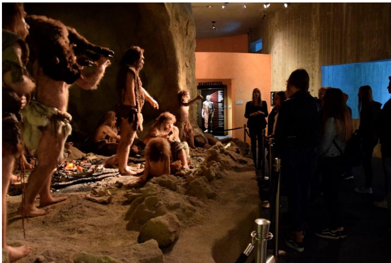
Slika 3. Muzej neandertalaca u Krapini