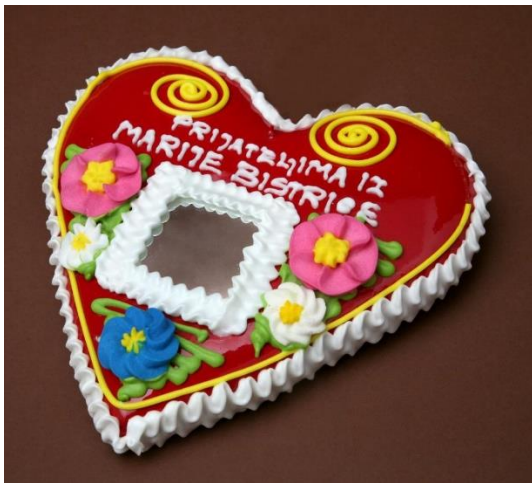
Slika 4. Licitar