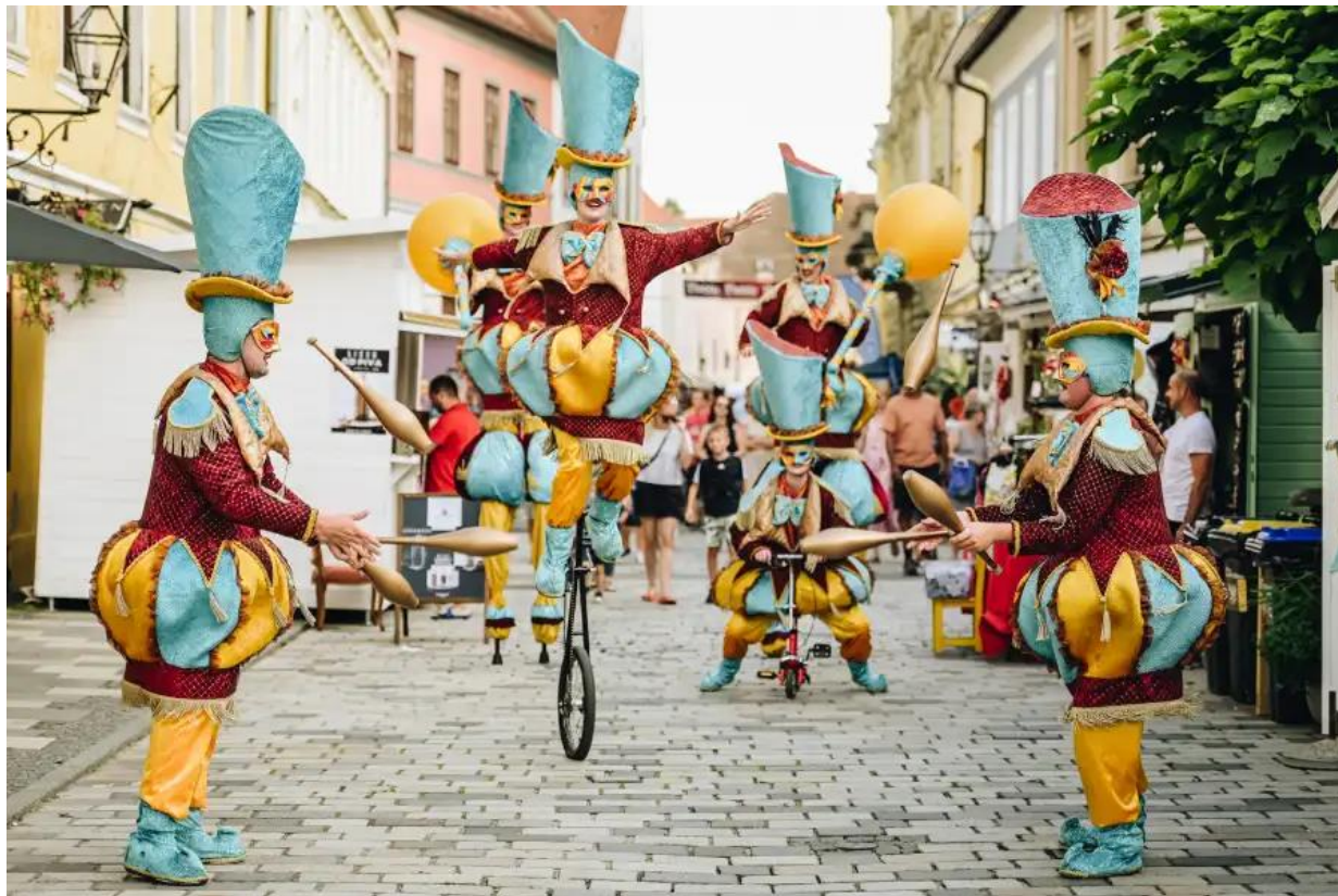
Slika 4. Ulični nastup