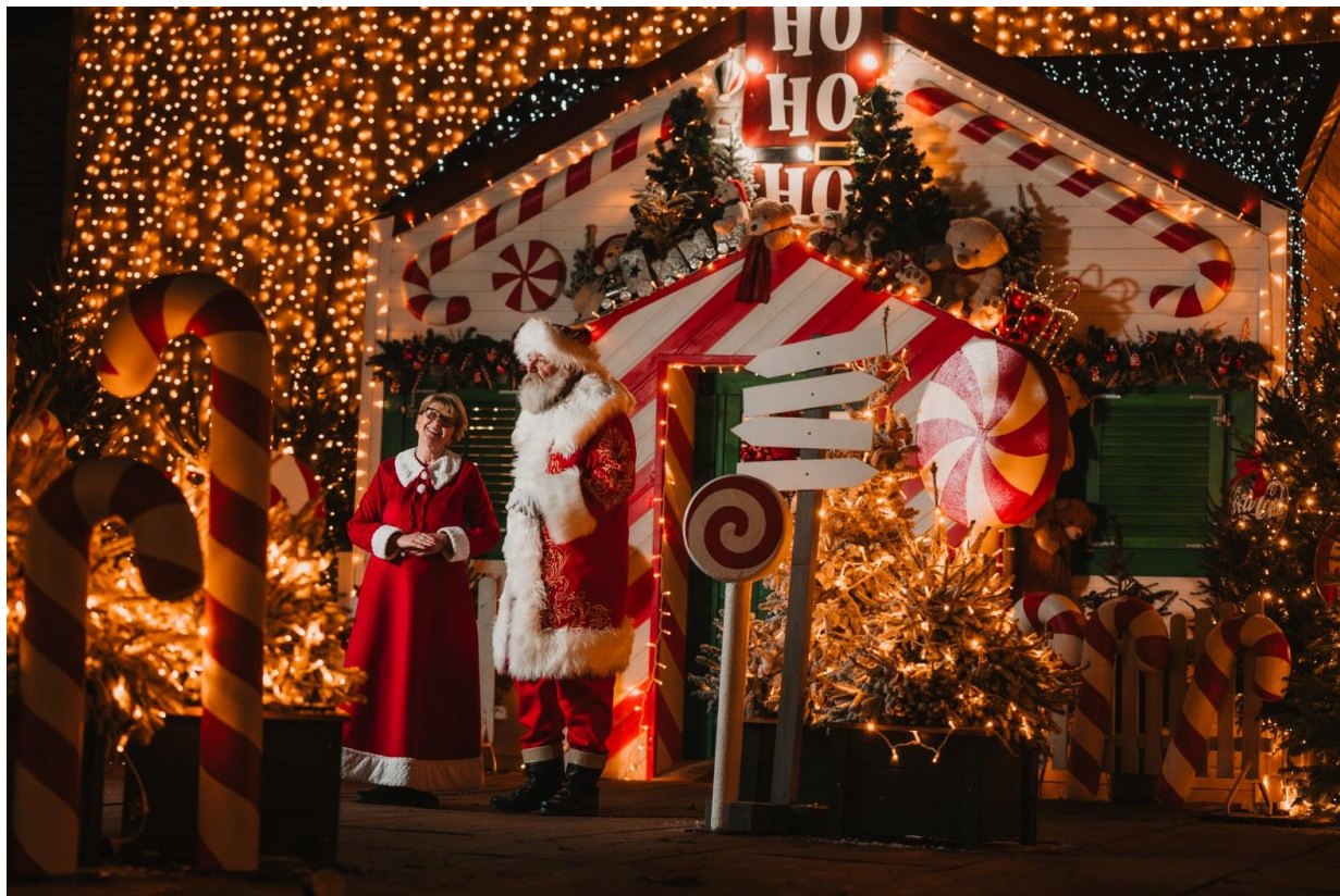
Slika 6. Kuća Djeda Mraza