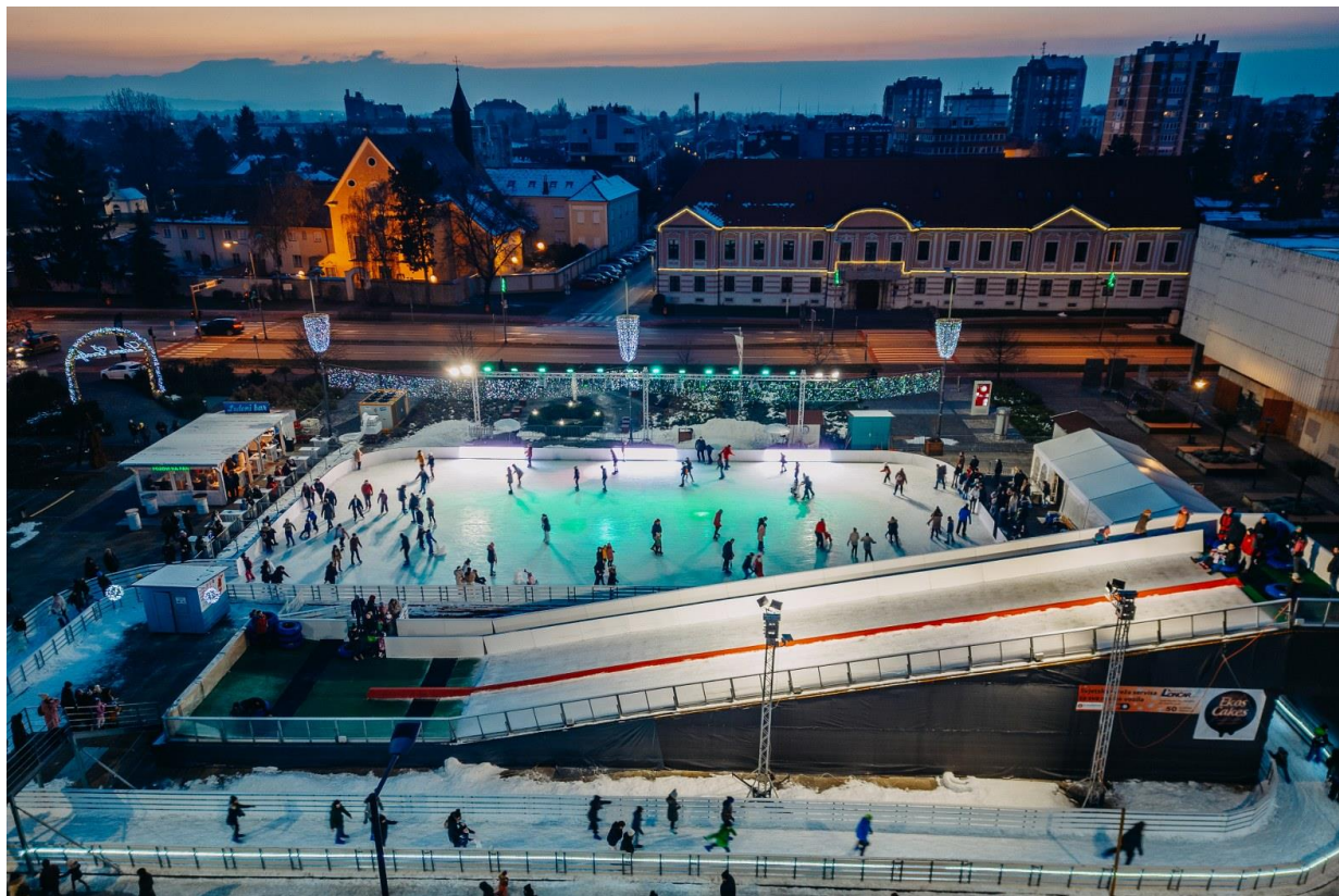
Slika 8. Varaždinsko klizalište i ledeni tobogan