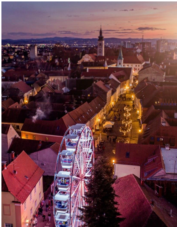
Slika 7. Panoramski kotač

Izvor: https://i0.wp.com/www.putoholicari.rtl.hr/wp-content/uploads/2024/01/Panoramski-kotac_827x1050.jpg?fit=827%2C1050&ssl=1 , 27.06.2024.