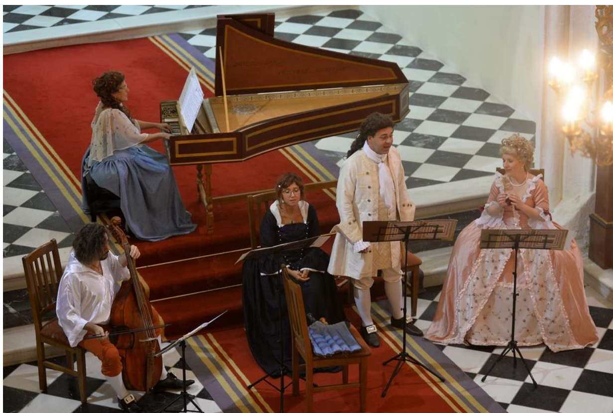
Slika 5. Program izvođenja klasične glazbe