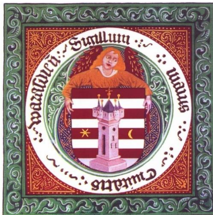
Slika 1. Grb grada Varaždina

Izvor: https://varazdin.hr/povijest-gradski-grb/ , 25.06.2024.