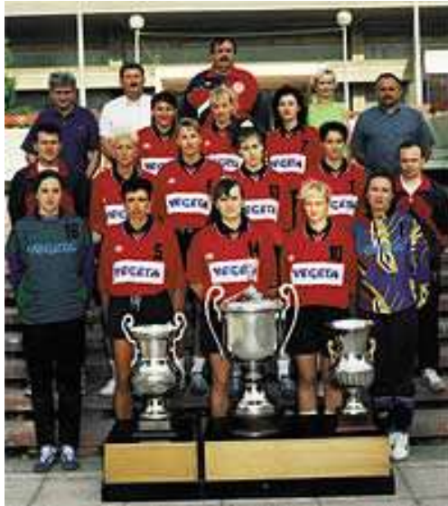
Slika 7: Podravkašice sa tri pehara: Prvak Europe, prvak Hrvatske i pobjednik Kupa Hrvatske