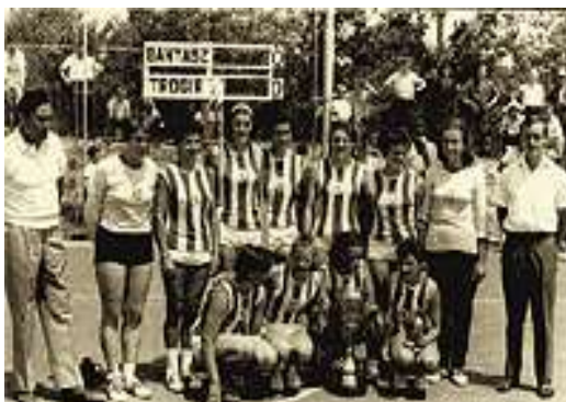
Slika 5: Prvi naslov prvaka države osvojila je ekipa 1966. godine