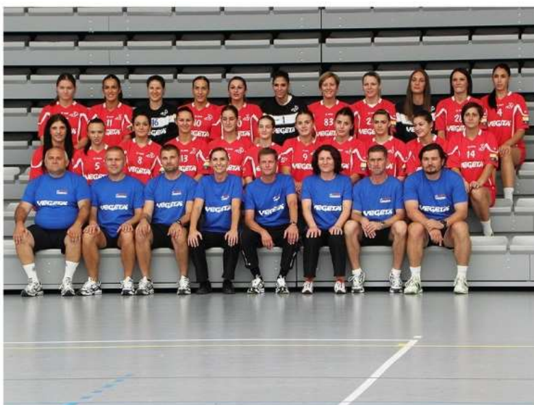
Slika 6: Ekipe Podravke koja je u sezoni 2012./2013. po dvadeseti put osvojila prvenstvo Hrvatske