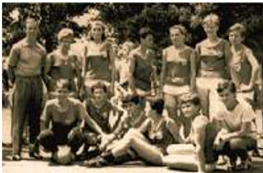
Slika 4: Ekipa koja se 1964. godine plasirala u Prvu saveznu ligu