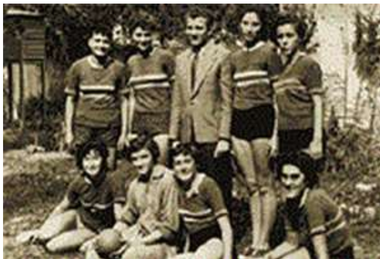
Slika 2: Prva fotografija koprivničkih rukometašica snimljena 1955. godine