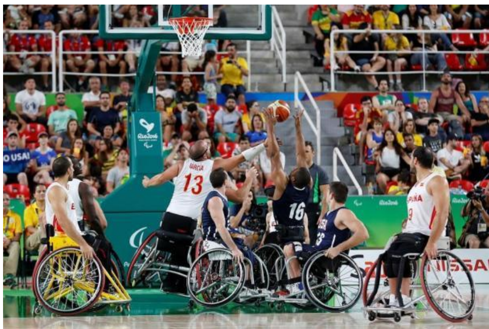
Slika 4: Prikaz utakmice košarke u kolicima