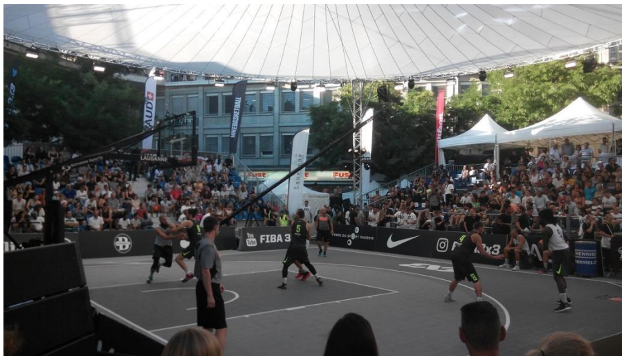
Slika 3: Prikaz utakmice u uličnoj košarci