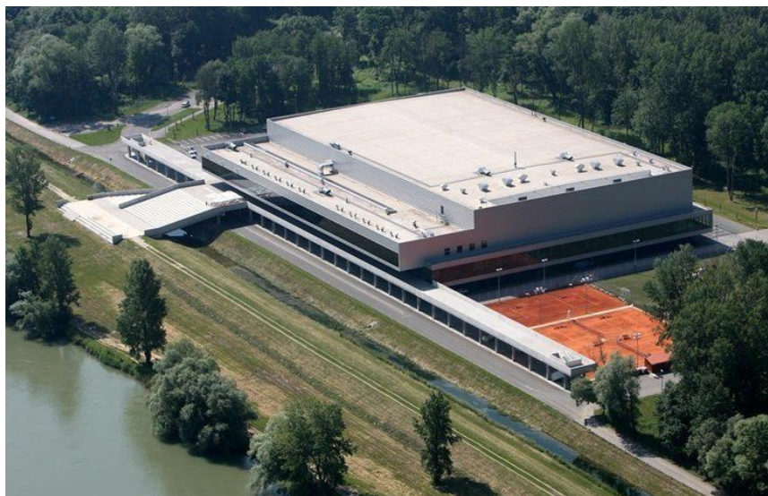
Slika 2: Arena Varaždin