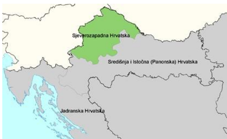
Slika 1: Prikaz sjeverozapadne Hrvatske