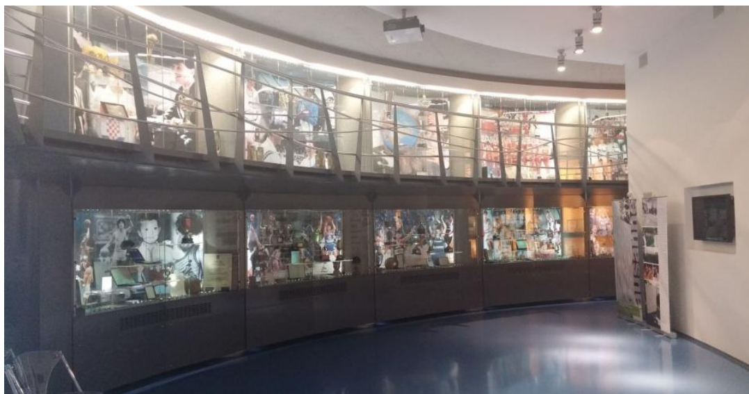
Slika 7: Muzejsko memorijalni centar Dražen Petrović