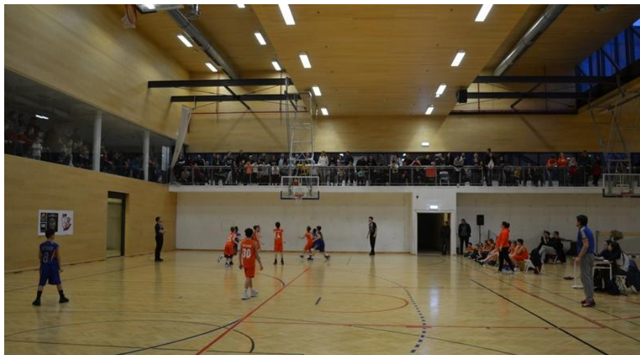
Slika 5: Prikaz utakmice u mini košarci