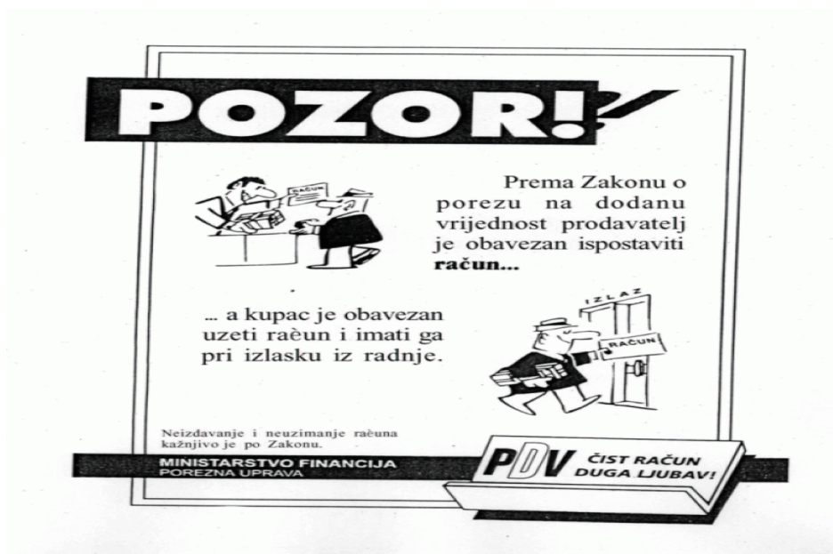
Slika 2. Naljepnica

Kod izvoza, obveznik je unosio podatak o vrijednosti isporuke u određenu kolonu. Obveznik uvoznik ili izvoznik također za sve takve poslovne radnje trebao je imati propisanu dokumentaciju, npr. uvoznu ili izvoznu carinsku deklaraciju.