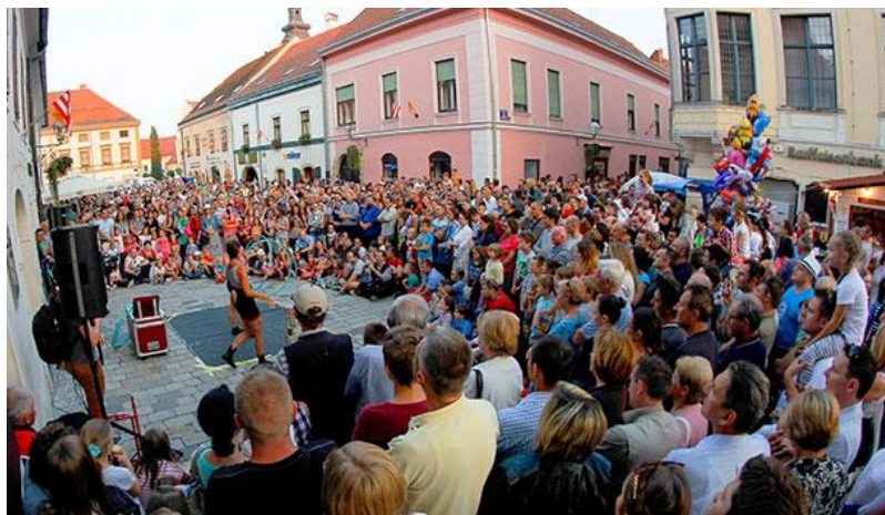
Slika 2. Ulice Grada Varaždina, tijekom održavanja Špancirfesta