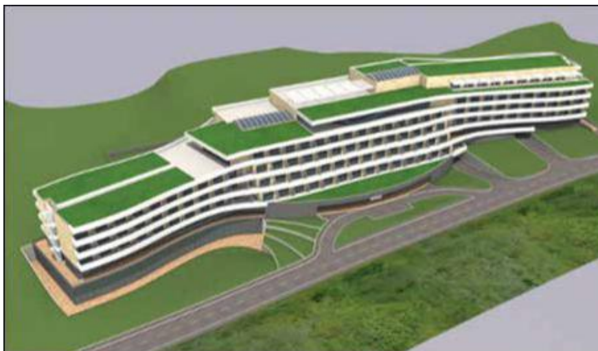
Slika 5. Vizualizacija projekta lječilišnog hotela "Jupiter" i spojne prometnice

Drugi projekt trebao bi stajati 11.400.945,00 eura, a uključuje izgradnju i opremanje novog medicinskog centra s medicinsko-stomatološkim kompleksom i novim spinalnim centrom (slika 6).