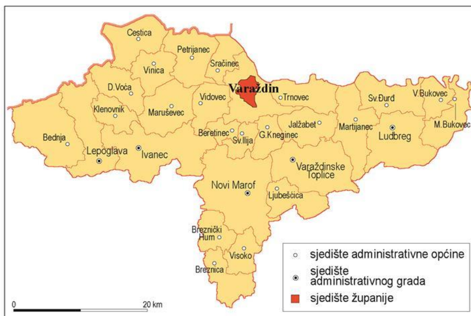
Slika 1. Geografski položaj Grada Varaždina