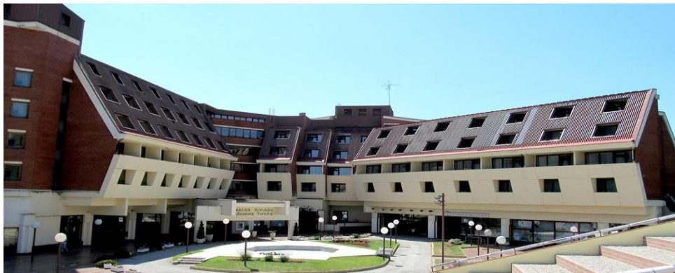
Slika 3. Hotel Minerva koji se nalazi u sklopu SB Varaždinske Toplice

banketna sala, mala dvorana, izložbeni prostor, praonica za goste, salon, izleti, parkiralište za goste i posjetitelje ( http://www.minerva.hr/minerva/ )