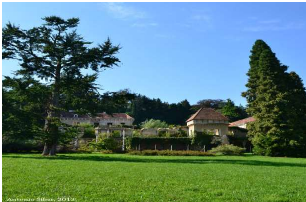
Slika 5. Ostaci dvorca Opeke