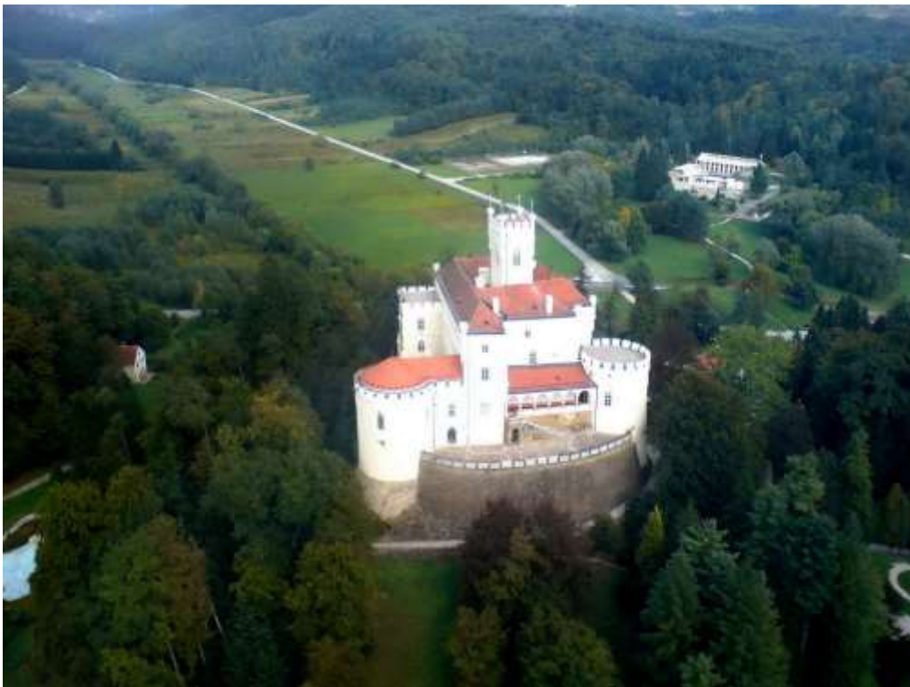
Slika 3. Dvorac Trakošćan

viteška dvorana u gradu. Današnji je trakošćanski grad zdanje arhitektonski složeno od ostataka izvorne gotičke arhitekture iz 14. stoljeća s elementima renesanse i baroka, koji potječu od pregradnji i obnove u 16. i 18. st. te od novih elemenata nastalih obnovom iz 1856. godine. 3