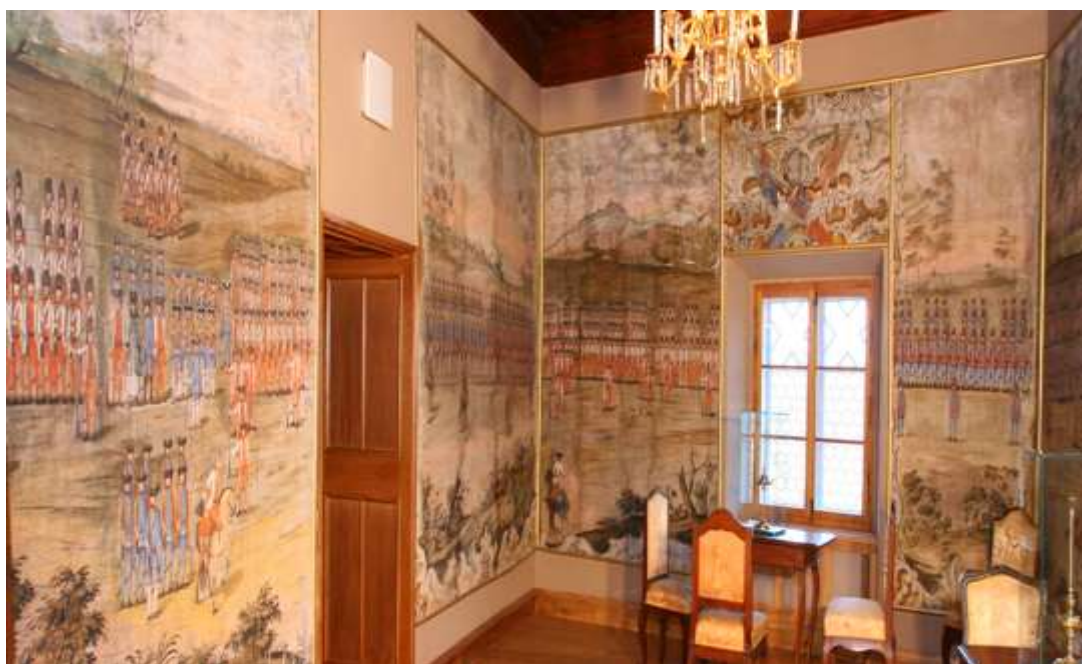
Slika 10. Soba oslikanih zidnih tapeta

On je ostavio sjećanje na Sedmogodišnji rat tako da je u dvorcu Trakošćanu u sobi na drugom katu dao oslikati tapete četama kojima je on zapovijedao. Primitivno izrađene igračke pravilno su poredane, a olovni vojnici iz božićne kutije također su pravilno razmješteni u formacije po propisanim ondašnjim pravilima. Na naslikanim četama može se vidjeti pravilna formacija koja se sastoji od časnika i štaba, ranaraca i kuhara poslužitelja. U prvom redu stoji jedan uniformirani lik – kuharica koja nosi trorogi šešir kao i svi ostali vojnici.