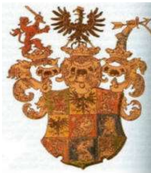
Slika 1. Grb obitelji Drašković

Draškovići su stoljećima živjeli u Hrvatskom zagorju i u krajevima hrvatskog kajkavskog područja. Njihovo podrijetlo dolazi iz Južne Hrvatske, iz Buške župe u Lici. Još nije utvrđeno kojem su rodu pripadali u plemenu. Smatra se da su pripadali plemenu koje se razvilo izvan skupine poznatih dvanaest hrvatskih plemena na što ukazuje i najstariji grb obitelji Drašković koji se sastoji od štita u kojem se nalazi grifon (orlolv). Taj grb pokazuje da velikaška obitelj Drašković ne pripada niti jednoj skupini od dvanaest hrvatskih plemena. Ime Drašković dolazi od oblika Draško, što znači drag, s nastavkom -ko. Može se zaključiti da su Draškovići čistokrvni hrvatski rod s podrijetlom oko mjesta Žažična (danas Pazarište) u Lici.