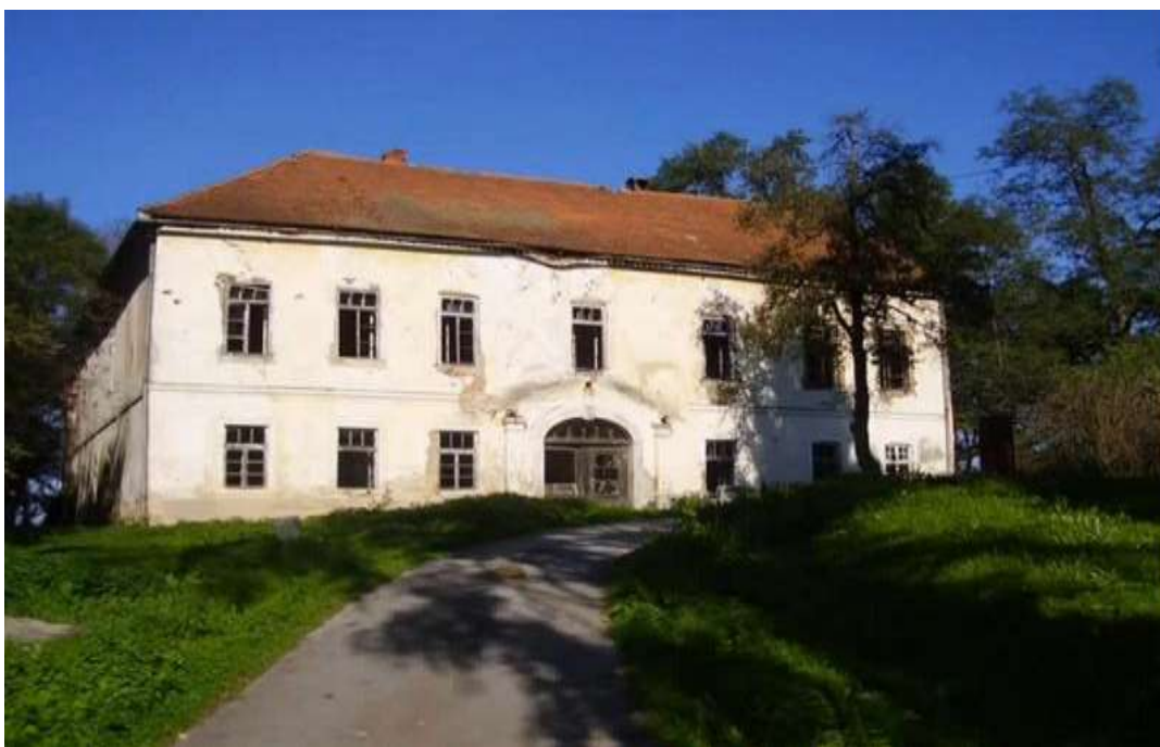
Slika 8. Dvorac Rečica

U Rečici se nalazila velika žitnica od hrastova drva gdje se moglo spremati oko 2 000 vagana žita, kamo su Draškovići su dopremali žito i iz drugih posjeda. Uz Luku na Kupi, Rečica je bila njihovo najveće trgovačko središte. Draškovići su dobro iskoristili činjenicu da je Karlovac bio središte trgovačke razmjene, a trgovina i lađarenje Kupom godišnje su im donosili velike prihode. Posebna manufakturna radionica porculana nalazila se u gospodarskim zgradama u Rečici.