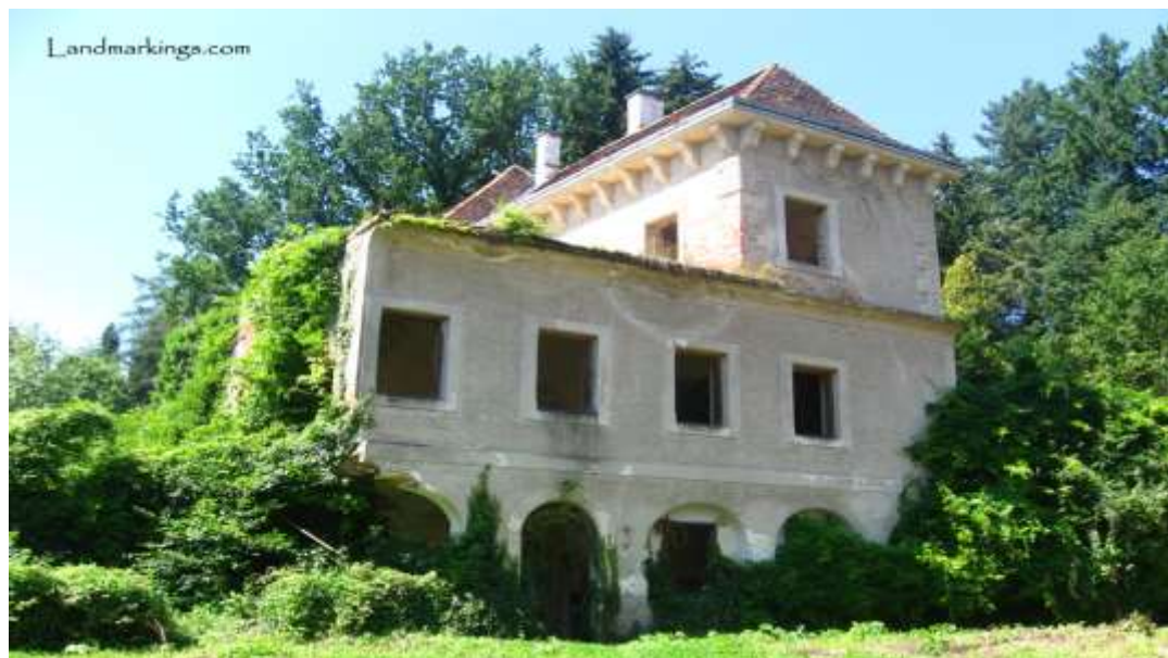
Slika 6. Zelendvor danas