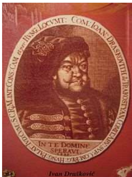
Slika 9. Ivan III. Drašković

Ivan III., sin Ivana II., rođen je 1603. godine. Njegov otac istaknuo se u bitci kod Siska 1593. godine s banom Tomom Erdödyem i bio je predsjednik Dvorskog ratnog vijeća. Ivan III. je bio treći po redu hrvatski ban u obitelji Drašković, a tu je dužnost obavljao od 1640. do 1646. godine. U njegovo vrijeme Draškovići su bili najjači i najbogatiji, a izgradio je i dvorac Klenovnik. Ivan III. je u Grazu završio filozofiju, a u Bologni pravo. Uz sve to, bio je istaknuti vojskovođa i jedini Hrvat koji je izabran za ugarskog palatina (1646.-1648.). Važno je napomenuti da je bio vitez Zlatne ostruge. Kralj Ferdinand II. dodjeljuje Ivanu III., Nikoli I. i njihovom bratiću Gašparu II. naslov grofova 1631. godine. Gašpar II. bio je sin Petra I. koji je pripadnik ljutomerske grane Draškovića. U doba kada je Ivan III. bio hrvatski ban, sabori su se održavali i u Klenovniku. Ivan III. umro je 1648. godine.