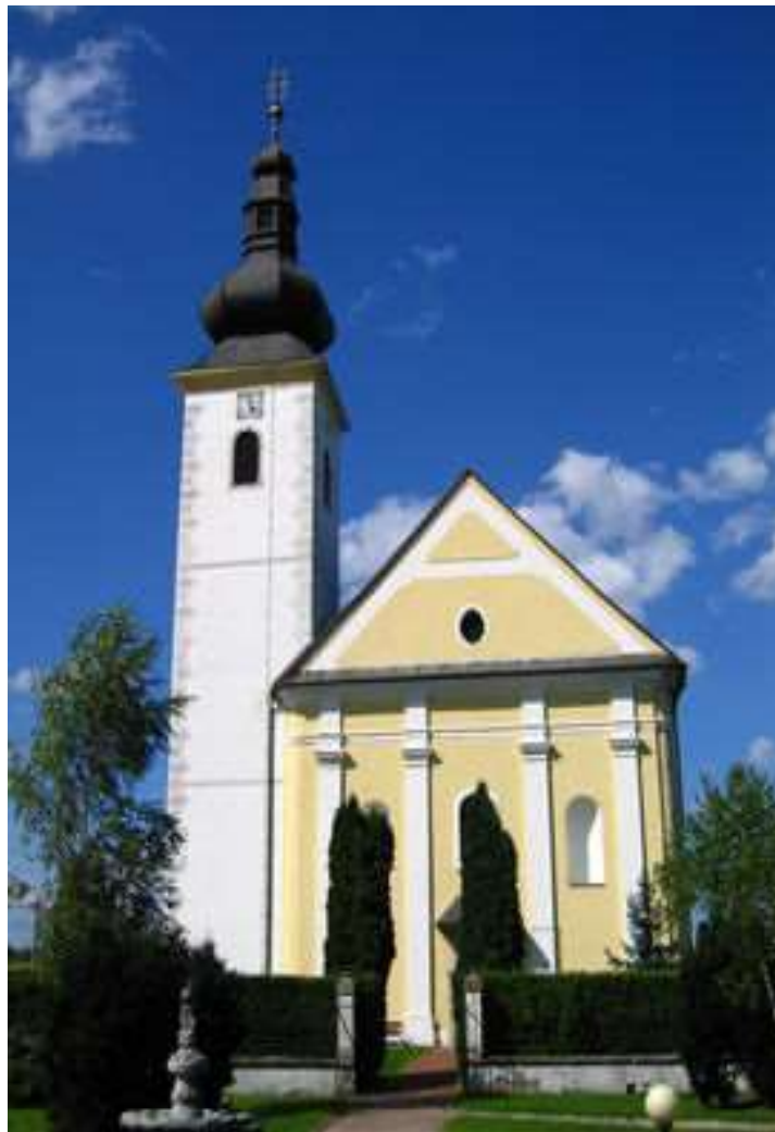
Slika 14. Crkva sv. Ivana Krstitelja u Rečici –danas

Dvostruki pečat utisnut prstenom obitelji Brandis i Drašković 8