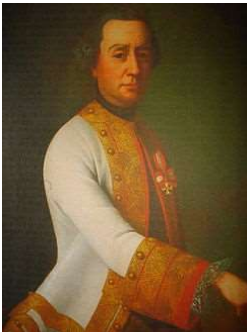
Slika 11. Portret Josipa Kazimira Draškovića