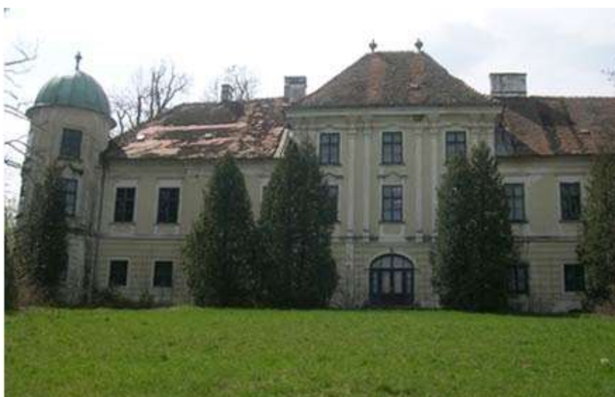
Slika 7. Dvorac Brezovica

U vrijeme kada su Draškovići posjedovali dvorac, Brezovica doživljava gospodarski i kulturni procvat, razvoj nacionalne svijesti i pismenosti naroda. Draškovići u 18. stoljeću podižu građevine po kojima je Brezovica nadaleko poznata: župnu crkvu Uznesenja Marijina i jednokatni barokni dvorac.