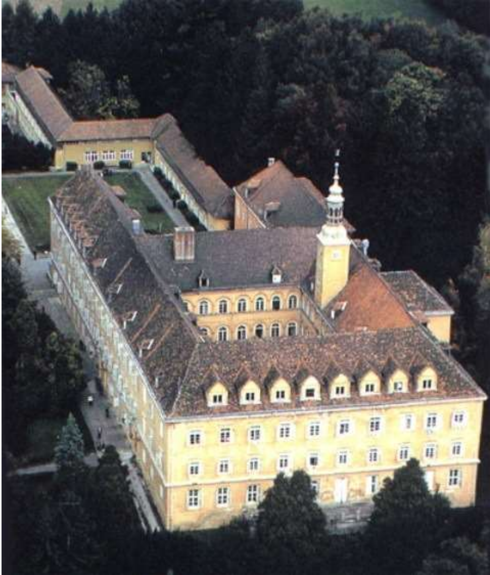
Slika 4. Dvorac Klenovnik danas služi kao bolnica za plućne bolesti i TBC

Dvorac Klenovnik u vlasništvu je Središnjeg ureda za osiguranje radnika od 1925. godine i potom je 1927. godine preuređen u sanatorij. Još i danas dvorac Klenovnik radi kao bolnica za plućne bolesti i TBC.